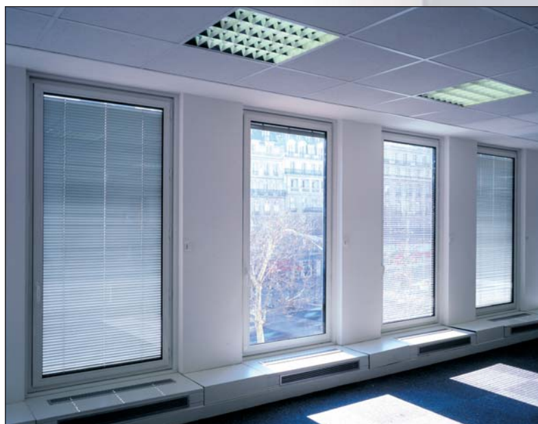
Par son store intégré dans l'ouvrant, K•Line A.I.R permet d'améliorer la gestion de l'occultation et supprime les besoins de maintenance et d'entretien.

Notons enfin, que la sécurité pour la protection contre la chute des personnes a également été prise en compte avec l'utilisation d'un vitrage feuilleté 44-2 en face intérieur . Un système conjugué à une ouverture limitée de seulement 11 cm par une butée de sécurité qui rend ainsi impossible l'ouverture totale de la menuiserie.