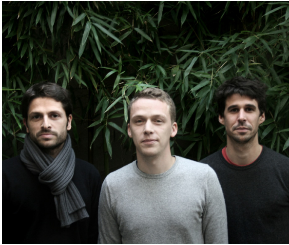
Les fondateurs de l'agence RAUM