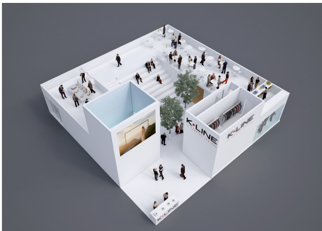
Projet du stand K•LINE à Batimat