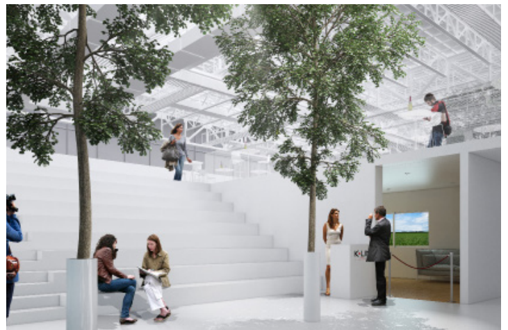
Projet du stand K•LINE à Batimat © RAUM