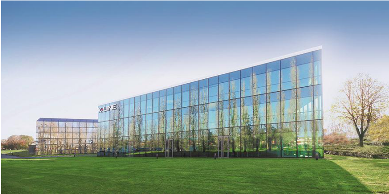
Siège de K•LINE, Les Herbiers, Vendée.

Afin de renforcer sa visibilité lors de l'édition 2015 du salon Batimat à travers une identité et une signature architecturale forte, K•LINE a décidé de s'associer à la revue archiSTORM pour organiser un concours sur invitation dans le but d'offrir à une jeune agence d'architecture l'opportunité de concevoir et réaliser son stand.